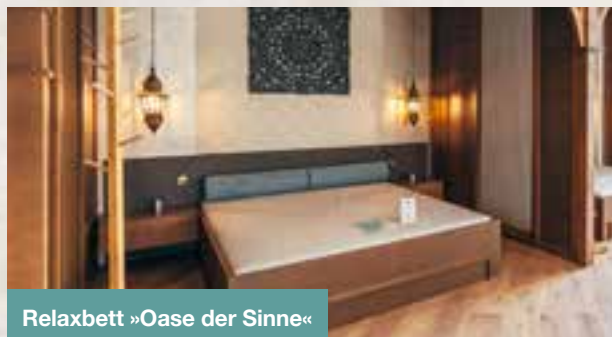
Relaxbett »Oase der Sinne«