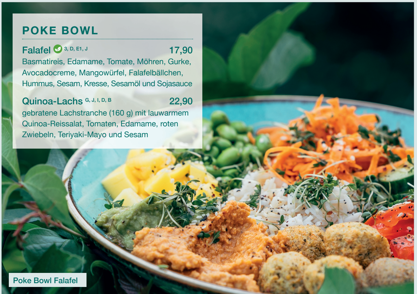
Poke Bowl Falafel

gebratene Lachstranche (160 g) mit lauwarmem Quinoa-Reissalat, Tomaten, Edamame, roten Zwiebeln, Teriyaki-Mayo und Sesam