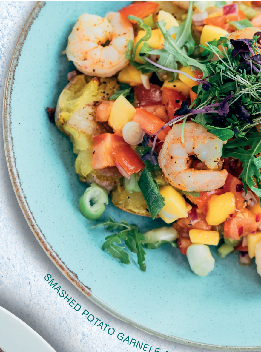
SMASHED POTATO GARNELE AVOCADO