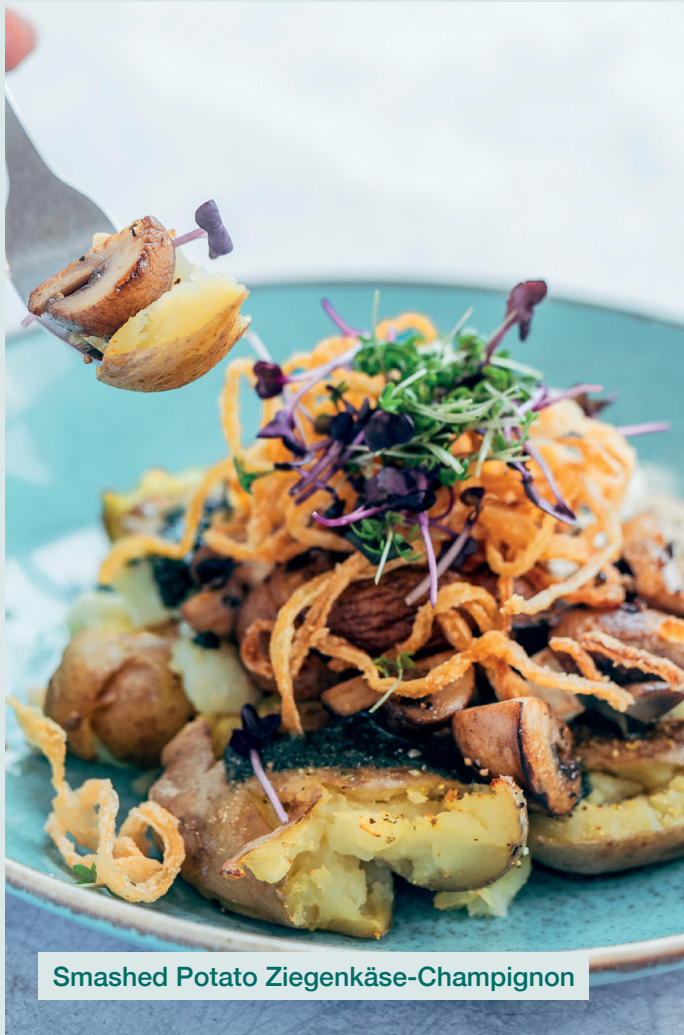
Smashed Potato Ziegenkäse-Champignon