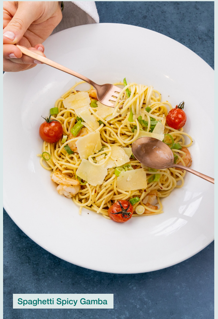
Spaghetti Spicy Gamba

gefüllte Ravioli mit Champignon-Kräuterfüllung, dazu gebratene Champignons, Parmesan, Frühlingslauch und Spirulina-Basilikumpesto