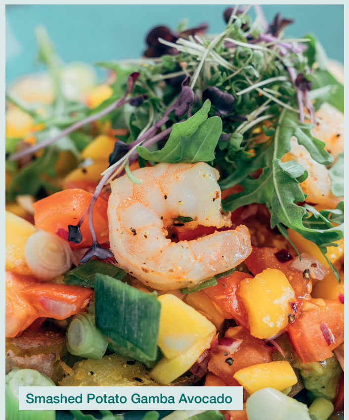
Smashed Potato Gamba Avocado