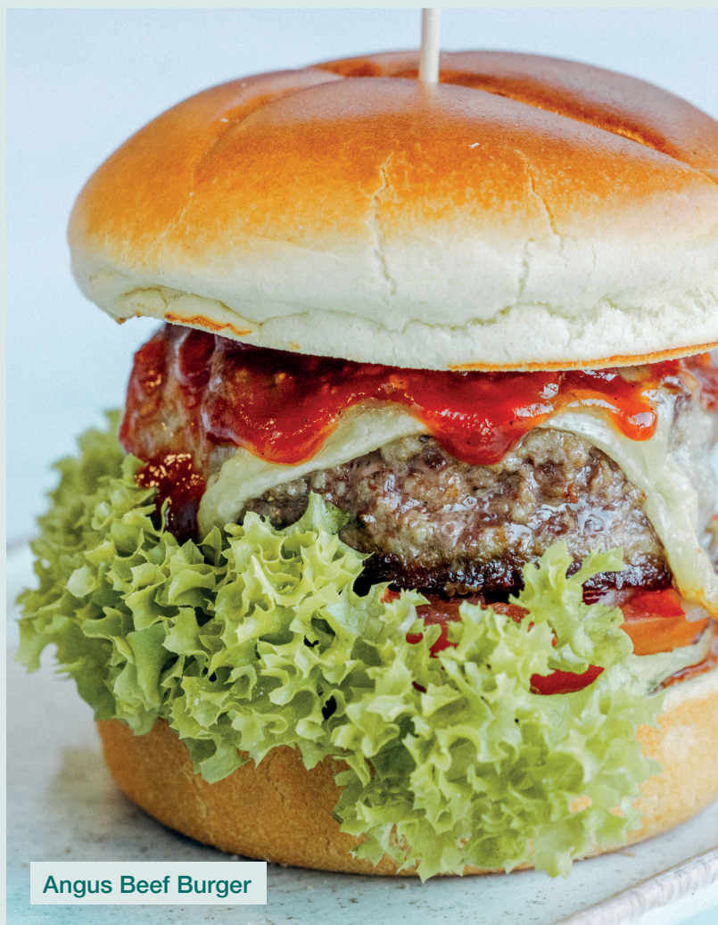
Angus Beef Burger