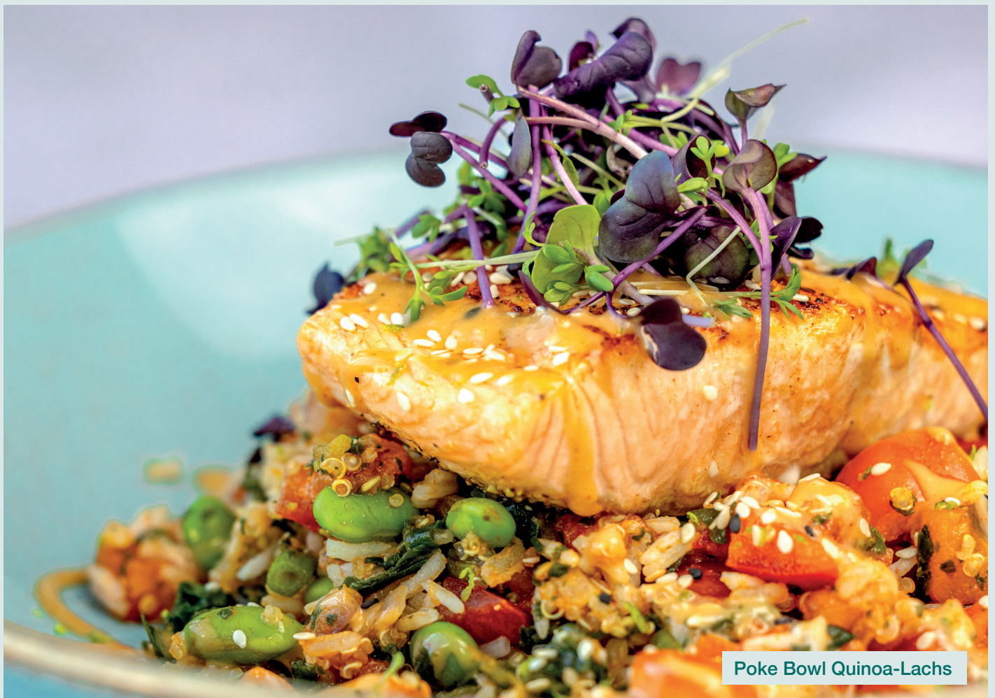
Poke Bowl Quinoa-Lachs